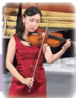
尾池亜美[ヴァイオリン]