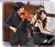
成田達輝[ヴァイオリン] 萩原麻未[ピアノ]