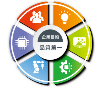
■ マテリアリティ * は用語集に掲載